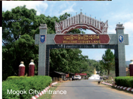
Mogok City entrance