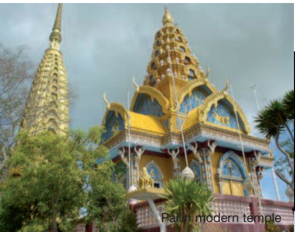
Pailin modern temple